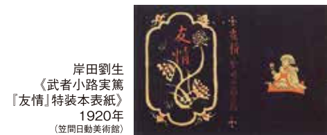
岸田劉生 《武者小路実篤 『友情』特装本表紙》 1920年 (笠間日動美術館)