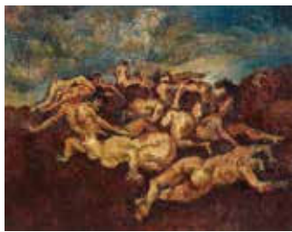
岸田劉生 《「天地創造」より 裸婦群像》 1914年頃 (笠間日動美術館)