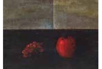
岸田劉生《静物(林檎と葡萄)》1919年 (笠間日動美術館)