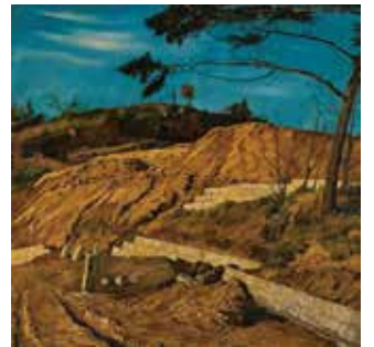
椿貞雄《赤土の山》1915年