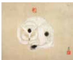
岸田劉生《猫図》1926年 (笠間日動美術館)