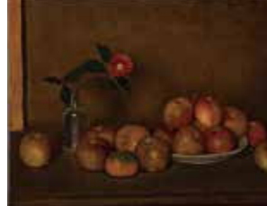
椿貞雄《静物(りんご)》1921年