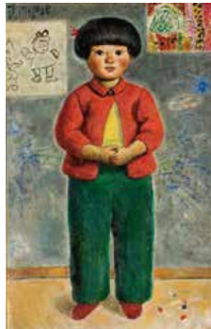
椿貞雄《彩子立像》1954年