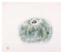
椿貞雄《冬瓜図》制作年未詳