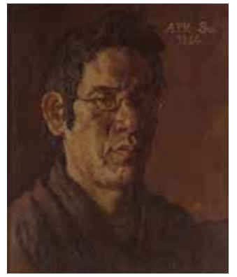
岸田劉生《自画像》1914年 (東京国立近代美術館)