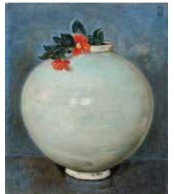
椿貞雄《壺(白磁大壺に椿)》1947年