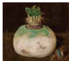
椿貞雄《蕪にくわい》1926年