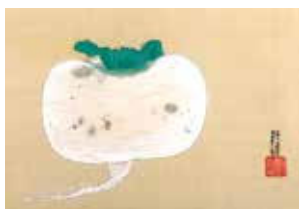
岸田劉生《蕪》1925年 (笠間日動美術館)