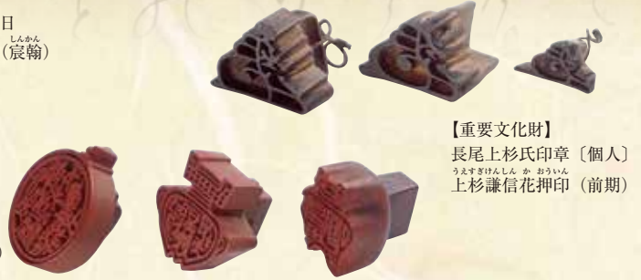
【重要文化財】 長尾上杉氏印章〔個人〕 上杉謙信花押印(前期)