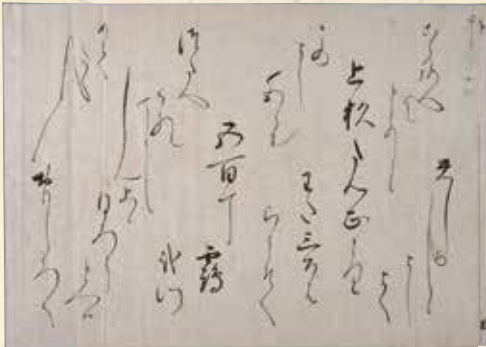
【国宝上杉家文書】寛永3年7月30日 三條大納言宛 後水尾天皇女房奉書(宸翰) (前期)〔米沢市上杉博物館〕

武家文書研究の最高峰である国宝上杉家文書の価値と魅力は広く知られるところですが、あらためて紹介するとともに、上杉氏や長尾氏と朝廷や公家とのやりとりの文書に着目し、新たな発見をご紹介したいと思ひます。同時に上杉家伝来の絵画、文芸書、刀剣、装束などの優品を一堂に展示します。