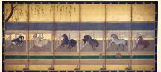
【山形県指定文化財】鹿園屏風 左隻(後期)〔米沢市上杉博物館〕