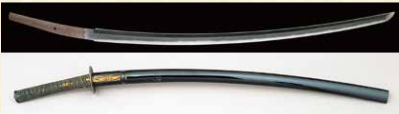
【重要美術品】太刀 銘 長船長光/文永十一年十月廿五日 黒漆打刀拵〔米沢市上杉博物館〕