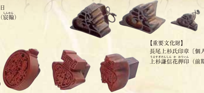
【重要文化財】 長尾上杉氏印章〔個人〕 上杉謙信花押印(前期)