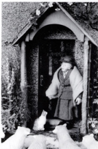
『ビターラビット』の作者ピアトリス・ボターのヒルトップハウスの立派（ボターと動物たち）

まずは子どもたちの情操教育にもご年配の方々のヒーリングにも自然に役立つドールズハウスのすばらしさを、凝縮された魅惑的な展示空間で、存分に堪能していただければ幸いです。さらに、ビジュアルな解説パネルやビデオを通して、ドールズハウスの6つの楽しみ、すなわち“見る”“学ぶ”“作る”“遊ぶ”“集める”“旅をする”をわかりやすく分類、できれば皆様ご自身で、その楽しみのひとつひとつに、ぜひご参加ください。