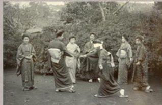
目隠し鬼に興じる女性達