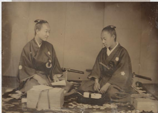
京都所司代郎の上杉茂憲(左)