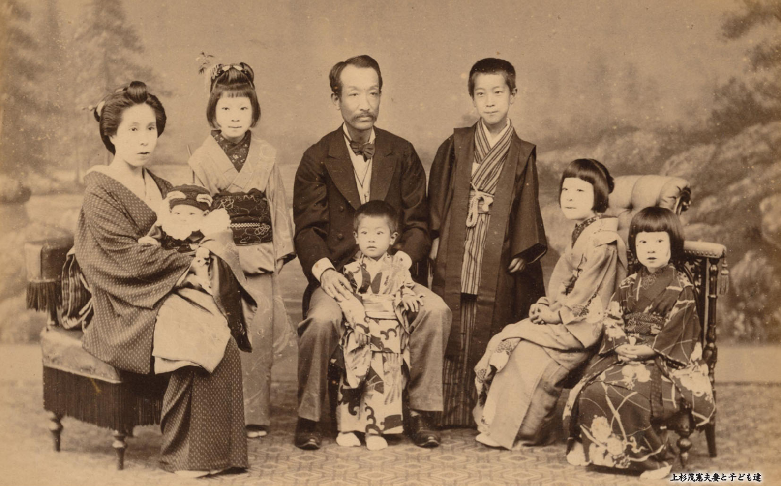
上杉茂憲夫妻と子ども達