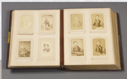
明治初期のアルバム