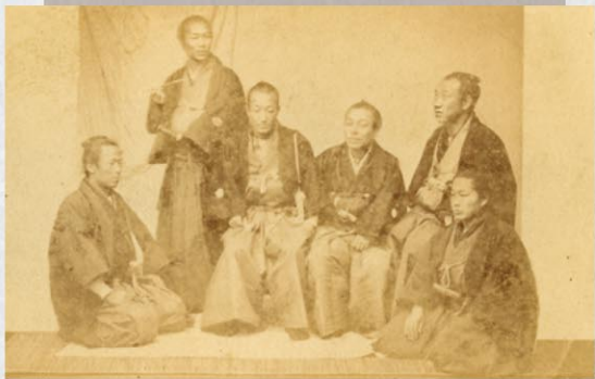
上杉茂憲と家臣達