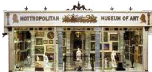
モトロポリタン美術館 1900 年代初期（アメリカ）