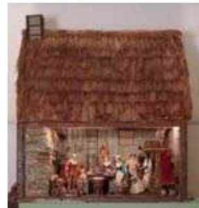
ピルグリム（清教徒）の住居 1900 年代初期（アメリカ）