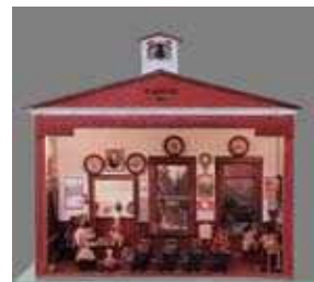
エルムウッド・スクールハウス 1900 年代初期（アメリカ）