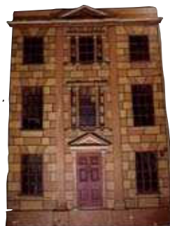
ジョージ三世王朝時代の家 1800 年（イギリス）