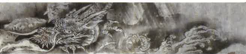
粉本 龍図(部分) 目賀多家 江戸時代後期