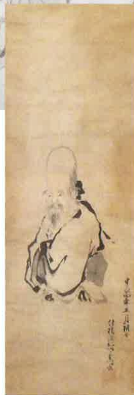
寿老人 目賀多守息 宝永4年