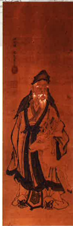
寿老人 左近司惟春 江戸時代