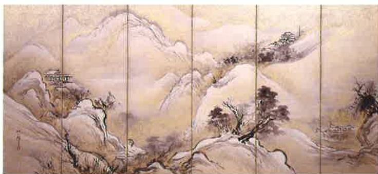
山水図屏風 目賀多信濟 六曲一双 江戸時代後期