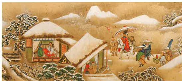
三顧草廬図(部分) 小田切寒松軒 宝暦11年(1761)