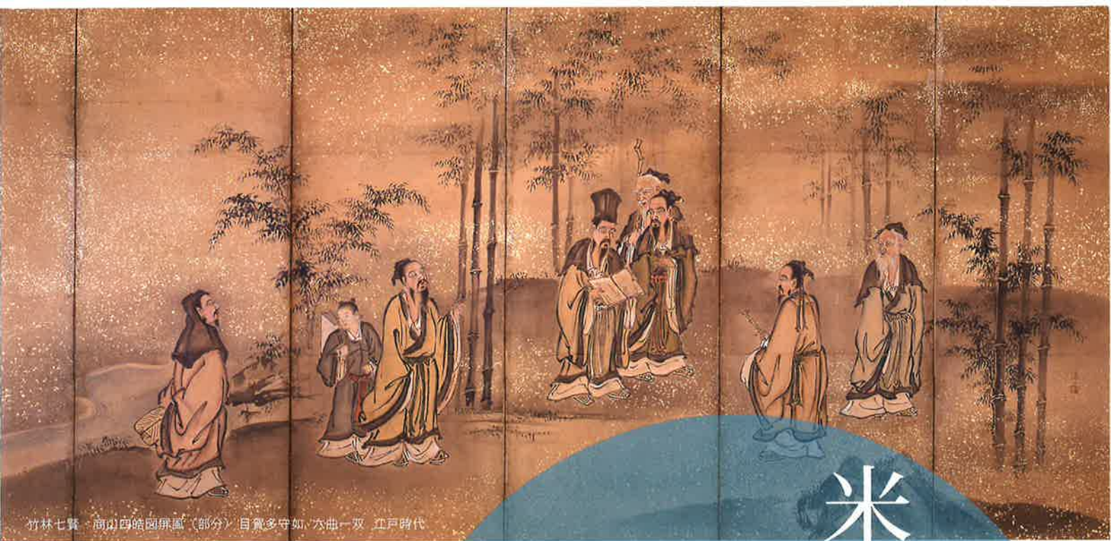
竹林七賢・商山四皓図屏風（部分）自寛多守如、六曲一双、江戸時代