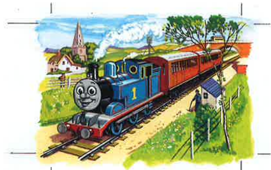
TANK ENGINE THOMAS AGAIN - PAGE 5 レジナルド・ダルビー『トーマスと車しよう』1949年

本展では、日本初公開作品を含む絵本原画を、人形劇、アニメとも重ね合わせて構成します。作品の魅力を味わいながら、原作者が子どもたちに伝えたかったメッセージに立ち返ります。