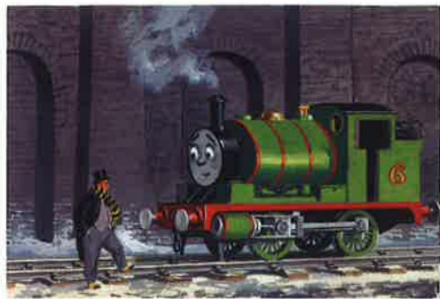
ジョン・T・ケニー 《みんなのだいひょう》1960年