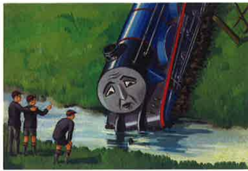
レジナルド・ダルビー 《ゴードンの脱線》1953年