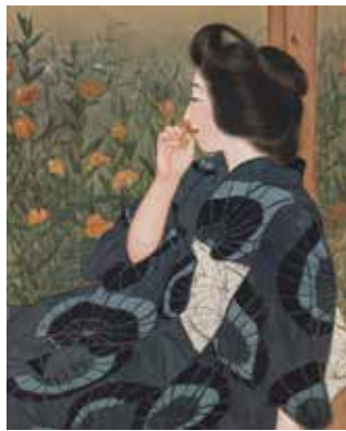
作品名未詳 (縁側)部分 吉池青園