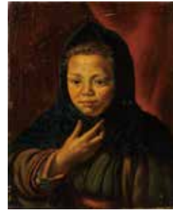
「雪国の少女」 椿貞雄

作家の身近な存在である家族をモデルにした女性像には、作家の家族への愛情と、描かれたモデルの飾らない自然体に宿る美を見ることができます。