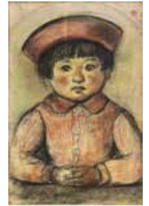
「彩子像 (赤い帽子)」 椿貞雄