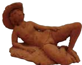
「横たわる女」 桜井祐一

学芸員が選ぶ美術の新収蔵品。 収蔵したからこそわかってきた 作品の価値を紹介します。