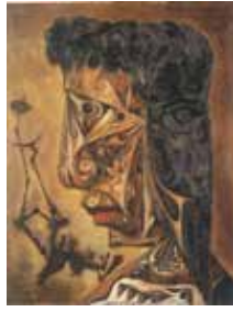
「私は獣です」と彼女はいった 浜田浜雄