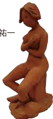
「腰かけた女」 桜井祐一