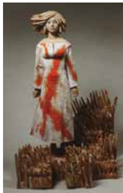
「記念撮影—鮫ヶ尾城」 峯田敏郎