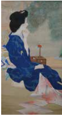
作品名未詳 (ものおもい) 吉池青園

伝統に則って描かれた「美人画」を中心に、1990年代に描かれたポップな女性像までを紹介します。