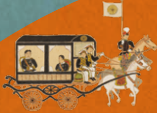
明治天皇巡幸輦路表 (当館蔵)