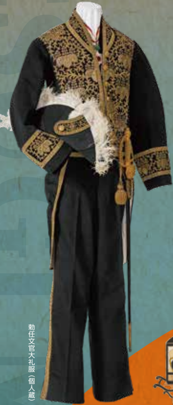
勅任文官大礼服 (個人蔵)