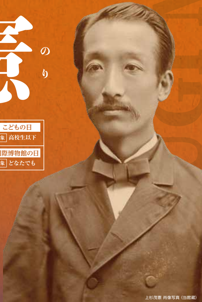
上杉茂憲 肖像写真 (当館蔵)