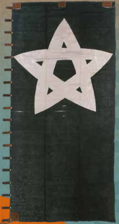
奥羽越列藩同盟軍旗 (宮坂考古館蔵)