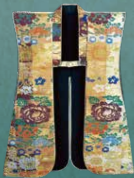
孝明天皇から拝領 牡丹菊常夏栴檀様錦陣羽織 （宮坂考古館蔵）〔前期〕