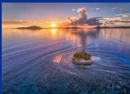
《小さな楽園》チューク諸島、ジープ島