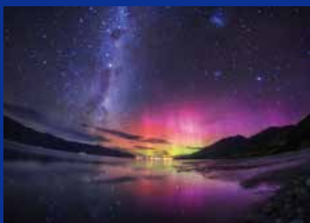
《銀河の果ての南極光》ニュージーランド、南島