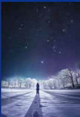
《夜空の宝石たち》北海道