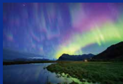
《薄明の空いっぱい》アイスランド