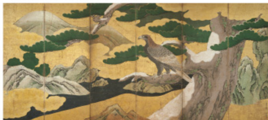
▲松鷹図屏風(右隻)[東京藝術大学] [後期]