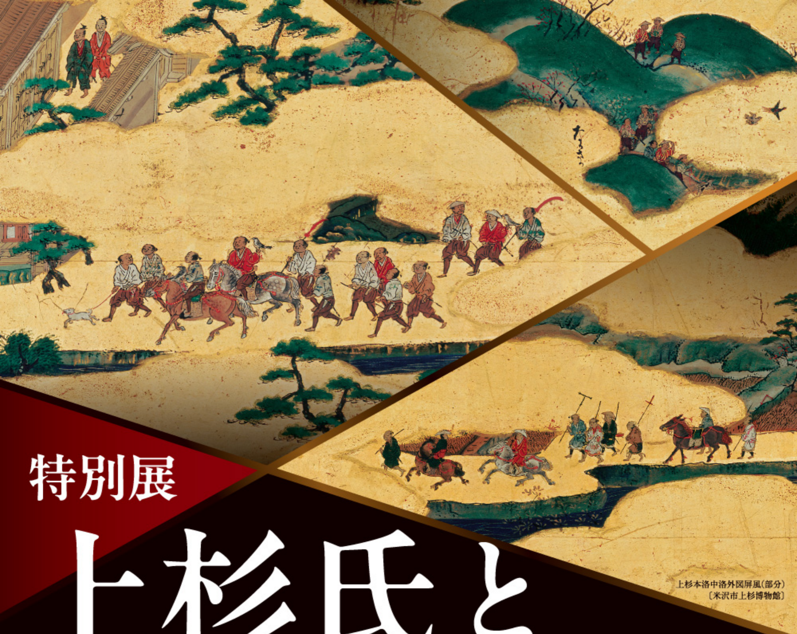
上杉本洛中洛外図屏風(部分) 〔米沢市上杉博物館〕