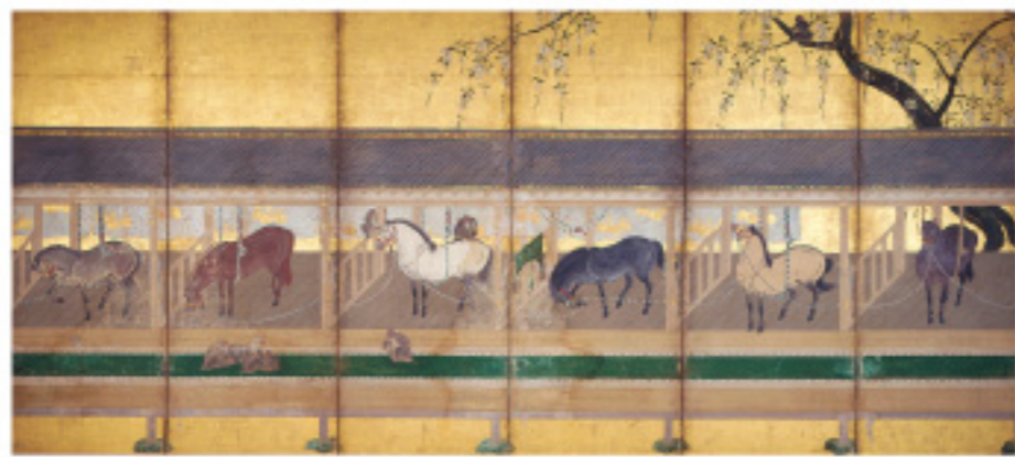
▲概図屏風(右隻)[米沢市上杉博物館] [前期]