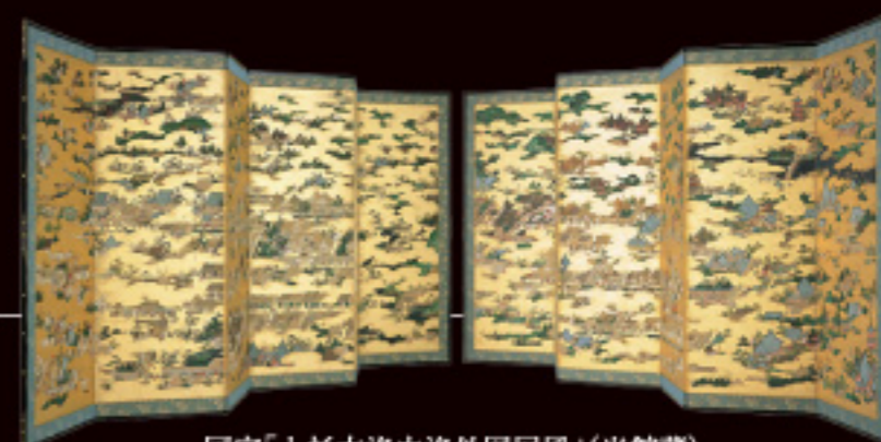
国宝「上杉本洛中洛外図屏風」(当館蔵)