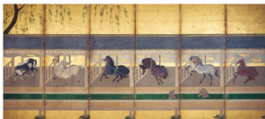
▲概図屏風(左隻)[米沢市上杉博物館] [前期]

このような中で戦国時代から江戸時代には、鷹や馬を題材とした障屏画が盛んに描かれました。武家が絶対的権力を握った社会的風潮の反映ともいえます。国宝「上杉本洛中洛外図屏風」にも多様な鷹や馬の姿が描かれています。以上のような視点から、鷹や馬を通じた上杉氏の歴史の一端に触れていただきたいと思います。