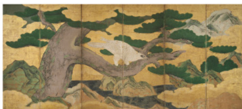
▲松鷹図屏風(左隻)[東京藝術大学] [後期]