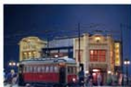
「モダン都市 銀座」2001年