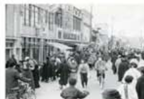
米沢初のネオン街路灯28基が駅前につく 開村の少年兵(昭和30年)