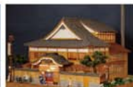
「明神湯 大田区雪谷」2007年