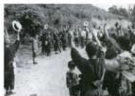
舟坂峠で村民に別れを告げる 開村の少年兵(昭和19年) 〔「米沢百年」より〕