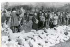
小学生も勤労奉仕(昭和18年) 〔「米沢百年」より〕