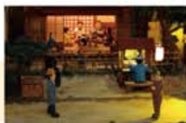
「梅ちゃん先生の町」2012年