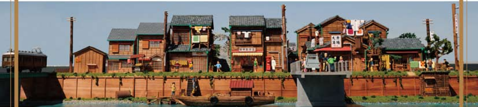
「梅ちゃん先生の町」2011年