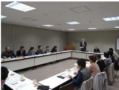
▲様々な意見や感想の発言で活発な会となりました。

このように全体会は職員とサポーターとがお互いを高め合う機会となっています。今後も積極的な参加をお願いします。