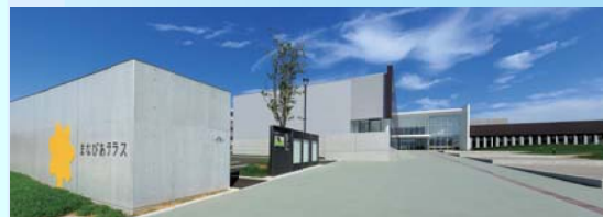
▲昨年11月にオープンした東根市の「まなびあテラス」。図書館や美術館などを備える複合文化施設です。

サポーターには詳しい案内を後日送付しますので、ぜひたくさんの方にご参加いただきたいと思います。