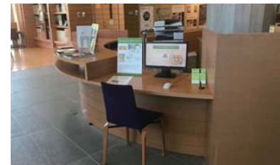
▲無料のスペースに設置。どなたでも操作できます。